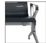
Piede-bracciolo alluminio lucido Polished aluminium leg-arm