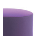
Versione bicolore Two colours version