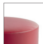
Versione monocolore One colour version