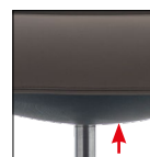
Meccanismo oscillazione sincronizzato autoregolante incorporato nel sedile (2° sedile/18° schienale) Self-weighting Synchron mechanism integrated in the seat (2° seat/18° backrest)