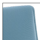
Sedile/schienale lisci Flat seat/backrest