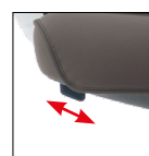
Alzo seduta Seat height adjustment