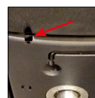
Regolazione eventuale intensità di oscillazione (con chiave in dotazione) Tilting tension adjustment (hex key included), if necessary