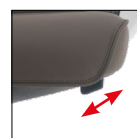
Blocco e sblocco oscillazione (3 posizioni) Tilt movement (3 positions)