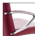
Bracciolo alluminio con soprabracciolo imbottito Aluminium arm with padded top