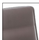
Sedile/schienale con cuciture lineari Linear stitching seat/backrest