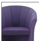
Schienale con cuciture Backrest with stitching

Butaca para reunión o espera en las versiones mono o bicolor realizados sobre estructura de acero relleno con resinas de poliuretano ignifugas.